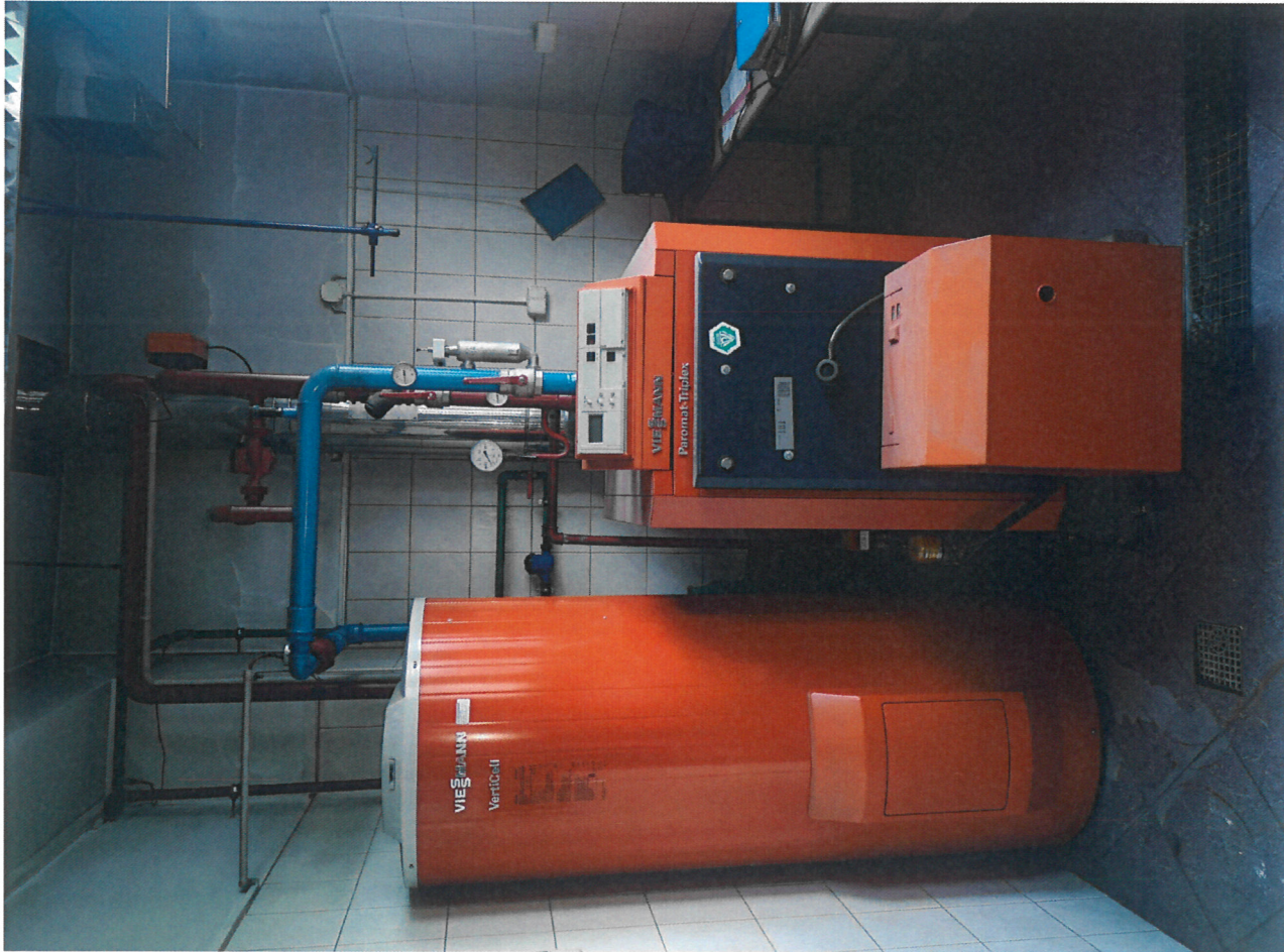
Dokumentacja fotograficzna do przetargu pisemnego na sprzedaż środka trwałego - kompletnej kotłowni olejowej, rok produkcji 1998. V postępowanie. Nr sprawy: DZ-235-70/23.